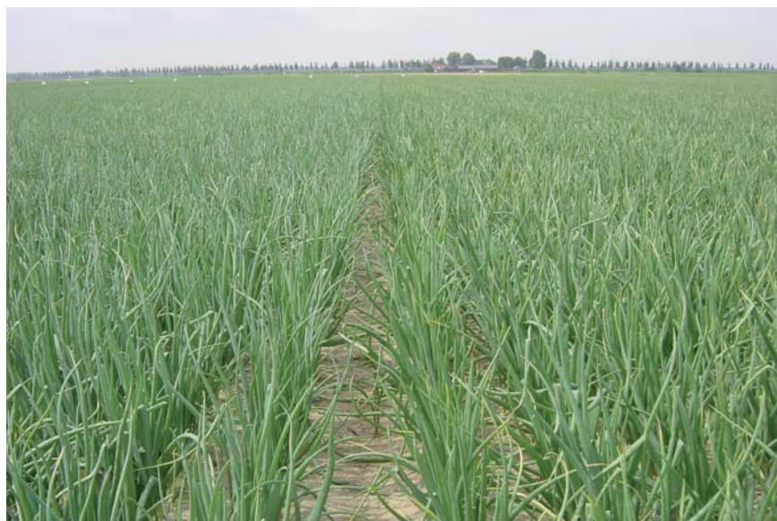
De rassenproef is onder goede omstandigheden geklapt en gerooid. Per ras was ca 6 ton product nodig voor een goede beoordeling.

In 2005 is het Uien Innovatie en Kennis Centrum (UIKC) gestart met het ketengestuurde rassenonderzoek zaaiuien. Er is gekozen voor een moderne onderzoeksmethode die is ontwikkeld in nauw overleg met de zaadhuizen en de afnemers. In 2006 is dit onderzoek herhaald. Zodoende zijn er nu over twee jaren en over twee locaties cijfers van de meest belangrijke bewaarrassen. Het onderzoek wordt in 2007 gecontinueerd.