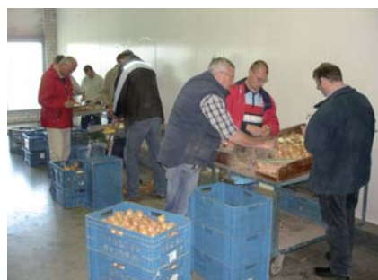
De uien zijn beoordeeld door een commissie deskundigen van diverse uienverwerkers en was een nauwkeurige karwei.

Dit is een uitgave van het Uien Innovatie en Kennis Centrum.